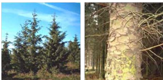
Figur 1 Sitkagran blev indført til Europa fra Nordamerika i 1830'erne, og træet kom til Danmark omkring 1850. I Danmark er den plantet i stor udstrækning, især i nord- og vestjyske klitplantager, i kystnære skove, på blødbundsarealer og på stærkt vindeksponerede lokaliteter. Den findes på omkring 34.000 ha, hvilket svarer til knap 7 % af det samlede skovareal (Skov- og naturstyrelsen).

I vest er plantagen præget af det barske klima og den sandede jordbund, mens man får et helt anderledes indtryk i plantagens østlige del, hvor der er mere løvskov. Her ligger kun et tyndt lag sand over den frodige jordbund. Længst mod øst grænser plantagen op til Tømmerby fjord, som hører til naturreservatet Vejlerne. I Østerild Klitplantage findes både de store vidder og den stille idyl. Plantagen er karakteriseret ved sin store variation, men også ved de mange tilbud til skovgæsten.